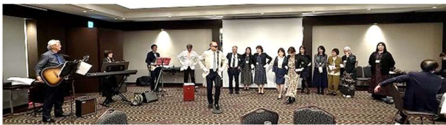
★手に手つないで合唱