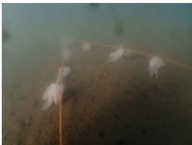
★アマモ保護カゴ設置