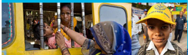
最初の3-Hポリオ補助金（1979年）