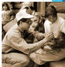
世界ポリオ撲滅推進活動（1988年）